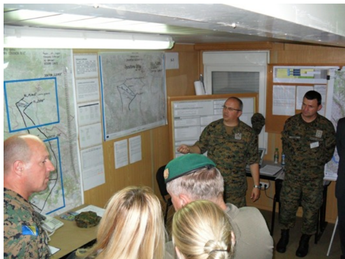
Zapovjednik 5.pbr OS BiH brigadir dr.sc. Kenan Dautović informira visoke goste o tijeku i provedbi vježbe

Na kraju da napomenemo, da je vježba vanjskog ocjenjivanja „Dinamičan odgovor 13-5“ provedena u specifičnim okolnostima kako po dinamici izvođenja tako i po sadržaju, broju sudionika. Pored kvaliteta prikazanih tijekom realizacije vježbe, treba naglasiti da je ovo bila