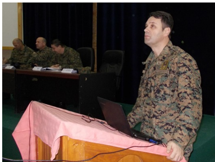
Zapovjednik brigade brigadni general Senad Mašović na otvaranju Glavne planske konferencije

Na samom početku priprema za vježbu „Dinamičan odgovor 13-05“ 05.12. 2012. godine održana je Inicijalna planska konferencija (IPC) u vojarni „Rajlovac“ na kojoj su usvojeni