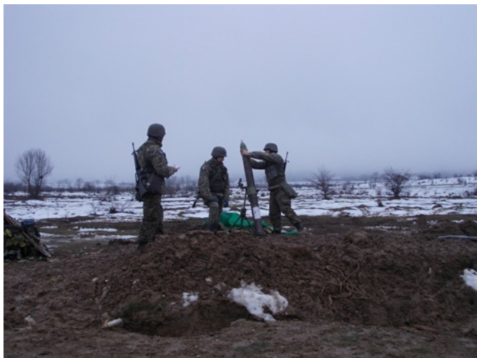
Kvalifikacijsko bojevo gađanje – Položaj MB 120mm

„ZOLJA“, koje su zajedno proveli 3.pješačka i Topnička bojna na poligonima SBO „Manjača“. Samom izvršenju gađanja prethodile su pripreme posada, kontrole ispravnosti oruđa i obučenosti pojedinaca, timova i postrojbi, da bi na kraju uslijedilo uručivanje Cetifikata od strane Zapovjedništva obuke i doktrine kojima je potvrđena obučenost i spremnost za završnu vježbu koja će uslijediti četiri mjeseca kasnije.